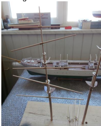
De ra's van voormast zitten eraan.