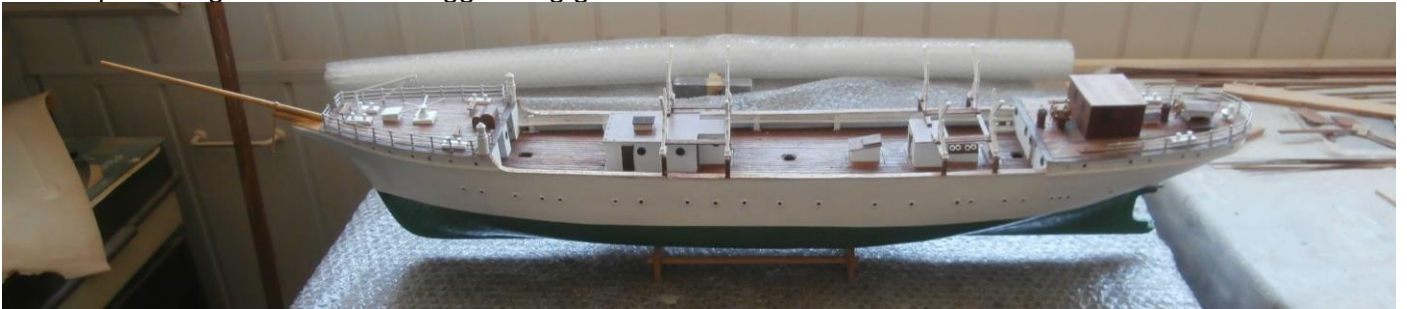
Overzicht van romp met dekken.