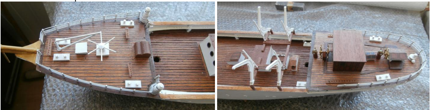
Het voor- en achterdek opgebouwd met details en beslag.