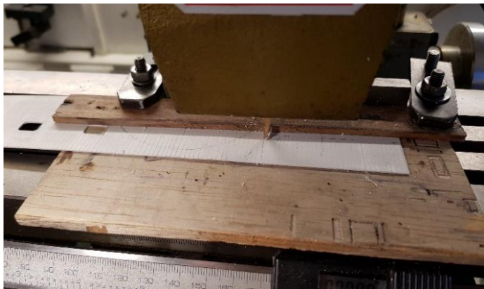
Graveren van de ramen in de wandplaat.