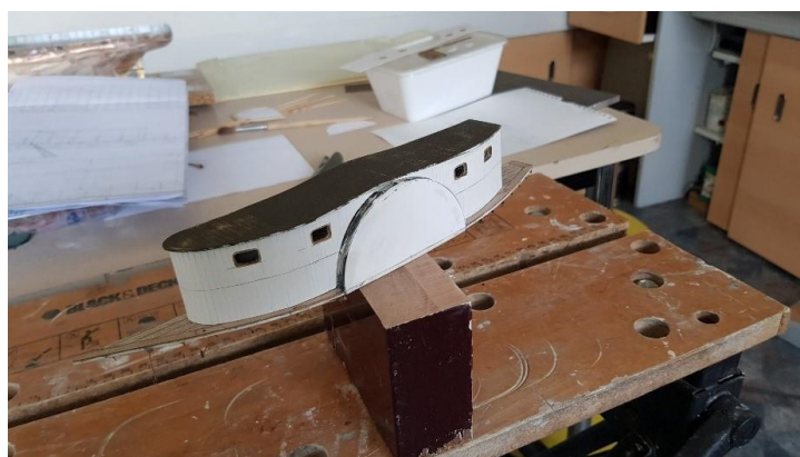
De pasgemaakte en gemonteerde wand, met Raamkozijnen met de plexiglas ramen.