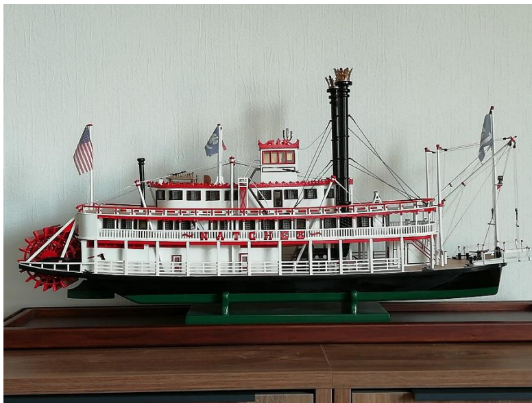
Mijn zelfgebouwde Mississippi-raderboot

Totdat ik op enig moment via en nog vele andere via's een tekening aangeboden kreeg, waarvan men zei, dat het een nagenoeg authentieke tekening zou zijn en anders in ieder geval ervan afgeleid. Deze tekening gaf mij dus wel het wauw-gevoel, ik toog aan het werk en na een aantal jaren intensieve huisvlijt, staat het model inmiddels alweer enige jaren, in een vitrine tegen het stof, te pronken op het dressoir in onze woonkamer.