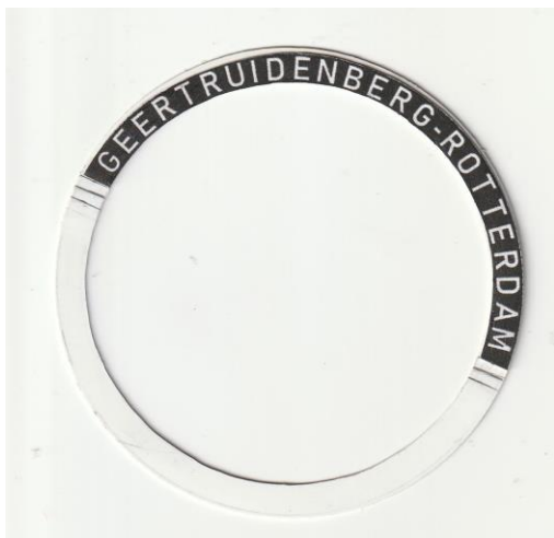
De ring voor de naam is klaar om op de kop van de radertunnel gelijmd te worden.