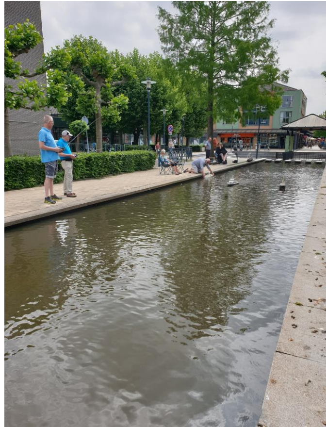
90 graden draai naar het noord-westen.