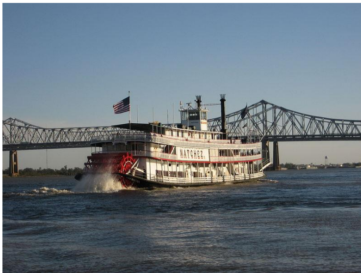
Raderboot "Natchez" op de Mississippi bij New Orleans

Hebben we het over rivieren in de Verenigde Staten, dan is de eerste naam die ons te binnen schiet: De Mississippi. Leden van de 'Binnenvaart' zullen dan allereerst denken aan de vaak gigantische duwkonvooien die de rivier bevaren, mijn gedachten gaan echter direct terug naar vroeger, toen de befaamde 'Mississippi-raderboten' daar hun weg zochten. Waren deze raderboten voorheen een belangrijk vervoermiddel voor passagiers, vee en andere vrachten, nu zijn zij slechts nog een toeristische attractie in met name New Orleans.