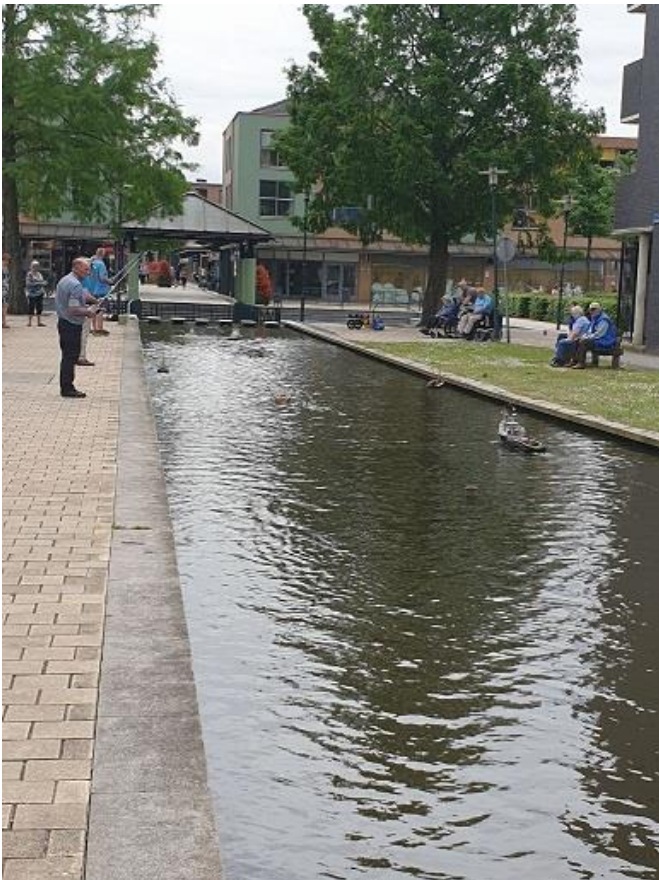
Zicht richting winkelcentrum.