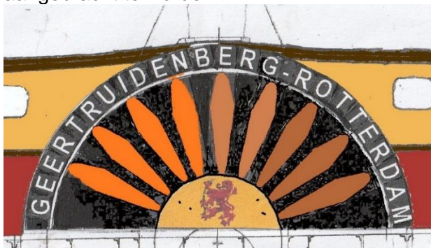
Detail van de kopwand in het voorontwerp