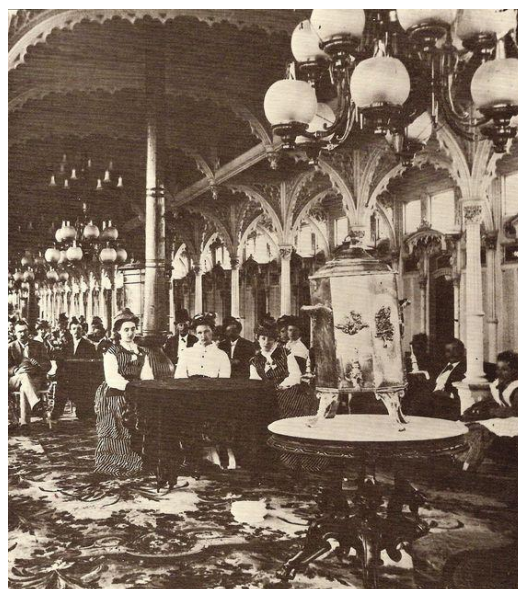
De protserige trap naar de .....luxe salon

De volgende aflevering gaat over de voortstuwing van deze schepen.