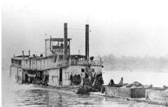
Hekwieler duwt een houtlichter