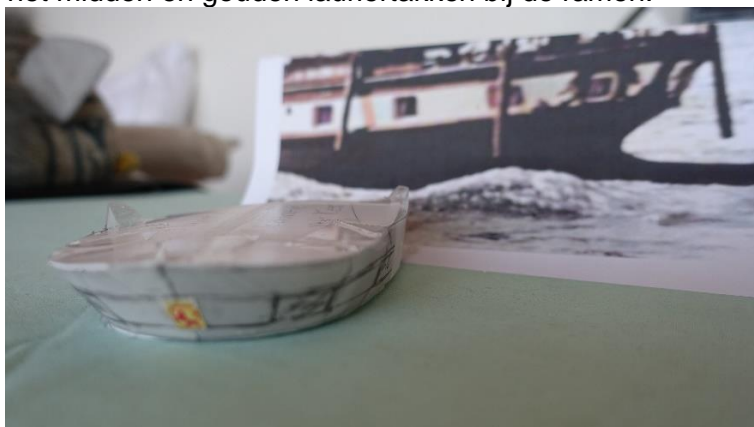
Stukje nagebouwde spiegel voor de uitslag van dit deel.